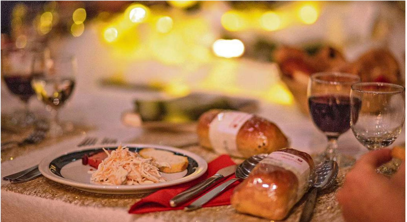
Gemeinsam statt einsam: Am 24. Dezember organisiert der Hilfsverein im Comandersaal eine Weihnachtsfeier für alle Interessierten.