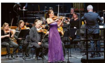
Das mutigste Festival: Zeitgenössischer Musik die grosse Bühne bieten, ist ein Risiko. Die Kammerphilharmonie Graubünden und das Ensemble Ot wagen es – auch zum 100. Geburtstag György Ligetis.