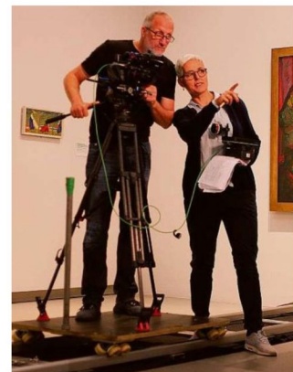
Die bildstärkste Erzählerin: Susanna Fanzans einfühlsamer Film «I Giacometti» über die Bergeller Künstlerfamilie wird zum erfolgreichsten Dokfilm in den Schweizer Kinos.